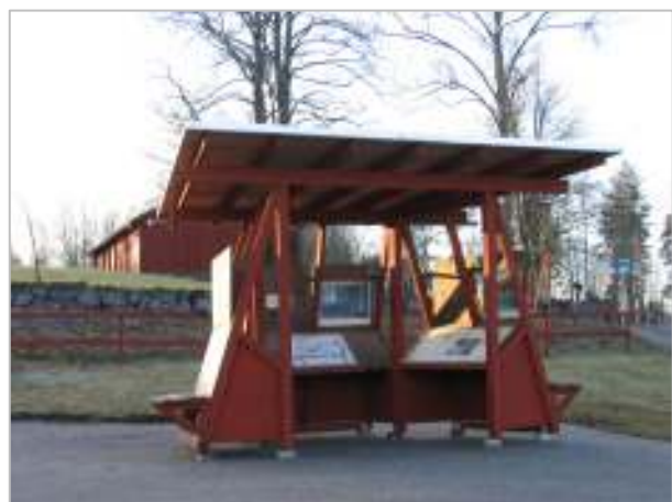
Informationsplatsen utvecklades under etapp 2 och är ritad av arkitekten Amelie Boson på Sweco FFNS Arkitekter AB.

Vi uppförde den tillgängliga informationsplatsen enligt de ritningar som togs fram under etapp 2. Syftet med informationsplatsen är att den ska vara lättillgänglig och innehålla ett lättillgängligt informationsmaterial samtidigt som platsen ska fungera som samlingspunkt. Viktigt är även att informationsplatsen smälter in i den kulturhistoriskt värdefulla miljön. Den är utformad efter de behov som finns hos människor med olika funktionsnedsättningar. Därför är alla mått, vinklar och funktioner framtagna för att tillgodose såväl personer med rörelsehinder, synnedsättning och nedsatt kognitiv förmåga.