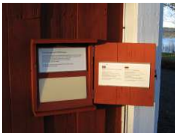
Skåpen innehåller information på lättläst svenska, engelska tyska samt med punktskrift.

Skåpen målades med falurödfärg, kulör Falu Ljus vilket är samma kulör som de aktuella byggnaderna har. Ett skåp målades dock i stället med linoljefärg i kulören guldockra. Skåpet monterades på stallet som består av en putsad byggnad i en närmast vit kulör, med ockragula fönsterbågar. Den ockragula kulören valdes, för att skåpet skulle smälta bättre in med byggnaden. Luckan till skåpen stängs med en hasp som utformades med ett litet öra för att underlätta fattningen om haspen.