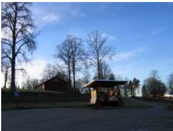
Informationsplatsen med handikapparkering till höger i bild samt gångväg upp till vägen, till vänster i bild.

Informationsplatsen har anpassats till den omgivande miljön genom sin färgsättning. Den är målad med falurödfärg, kulör Falu Ljus, liksom byggnaderna på gården. Trärena ytor har strukits med järnvitriol. Färgsättningen av informationsplatsens olika partier har utförts i samarbete med personer med synnedsättning. Målet har varit att skapa så stor kontrast mellan de olika fälten som möjligt. Taket försågs med svart takpapp och takets sidor kläddes med