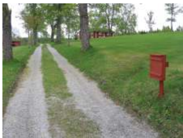
Ett skåp placerades i allén upp till anläggningen, med information om att det finns fler skåp med information om de olika byggnaderna.

För att man som besökare inte ska missa skåpen placerades ett skåp i allén med informationsskyltar som berättar att det finns fler skåp, på byggnaderna, med mer information. Enligt personalen på Siggebohyttan blev skåpen mycket uppskattade av besökarna och skapade nyfikenhet.