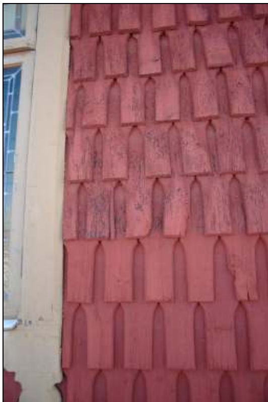
Spån i behov av åtgärd