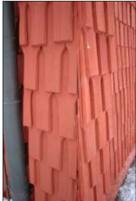
Knutlåda med mer glest placerade spån