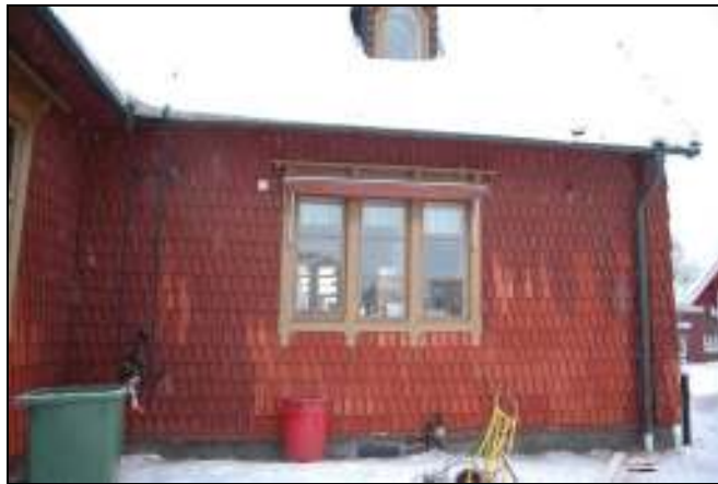
Sydvästra fasaden med utbytt spån, i huvudsak i nederkant