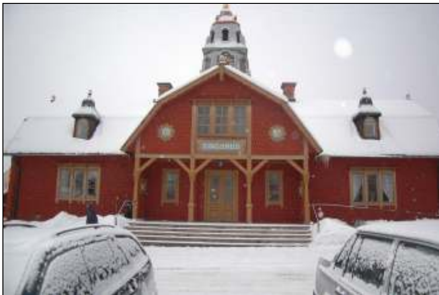
Östfasaden efter åtgärd