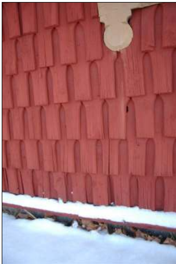
Vissa spån har sprickor