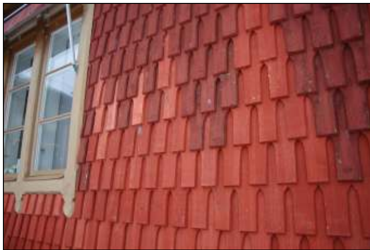
Äldre och nya spån blandade Ommålning av samtliga spån skall utföras