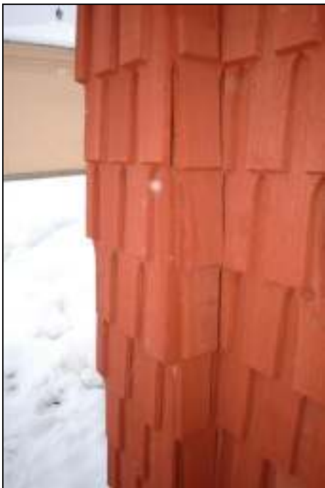
Knutlåda med tätare monterade spån