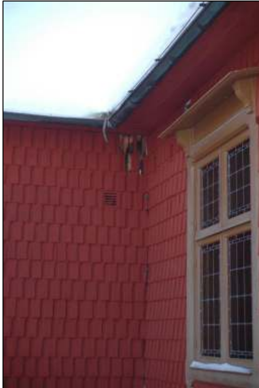
Fuktskada på nordvästra fasaden