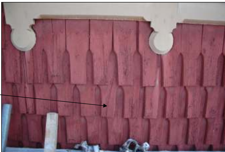
Spån sprucket mitt i skarven