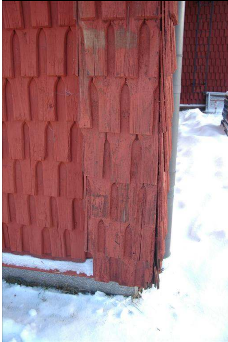
Knutlåda före åtgärd