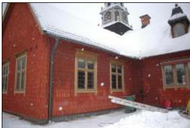
Sydvästra fasaden efter åtgärd