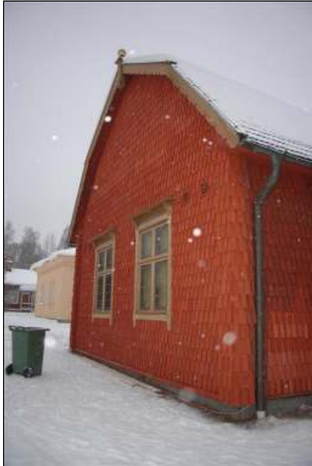
Västra fasaden med enbart nya spån