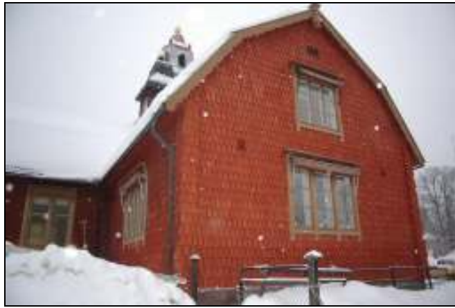
Södra fasaden med enbart nya spån