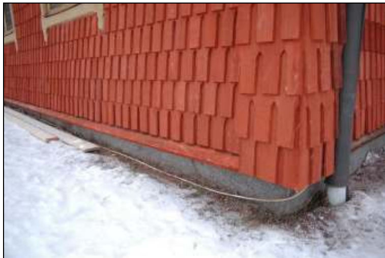
Ny vattlist är monterad på västra fasaden