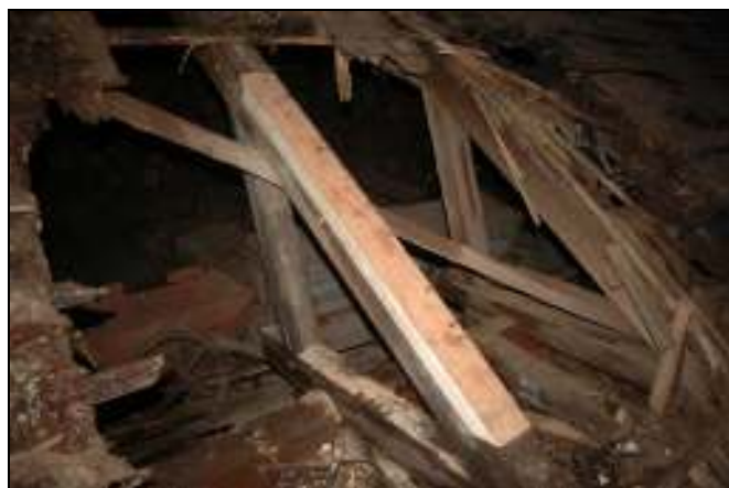
Lagning av rötskadat undertak samt takstol pågår