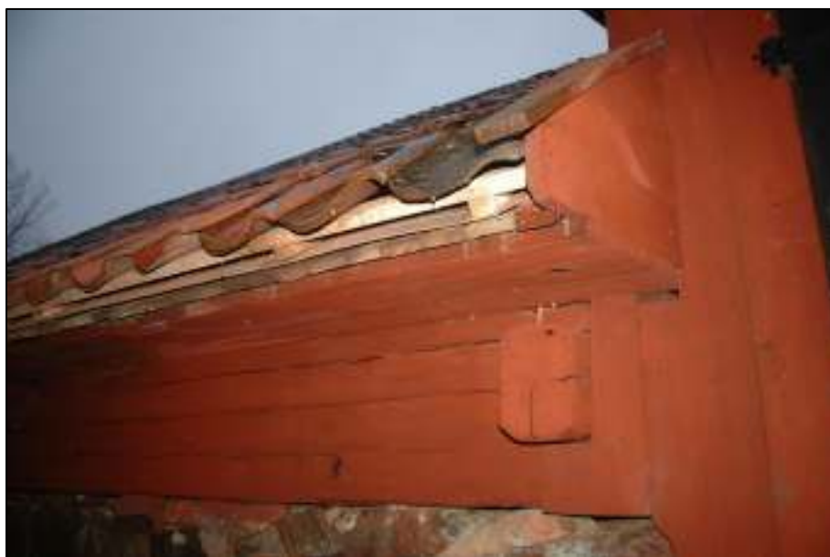
Efter åtgärd, endast rödfärgning av nedersta bärläkten återstår