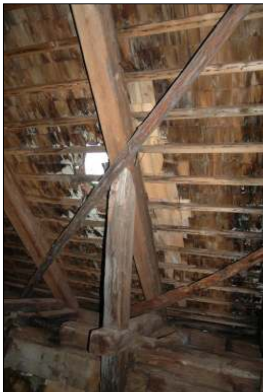
Lagning med laggstavar pågår