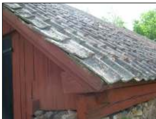
Vindskiva och del av tak innan åtgärd