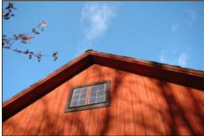
Södra gavelns vindskivor innan åtgärd