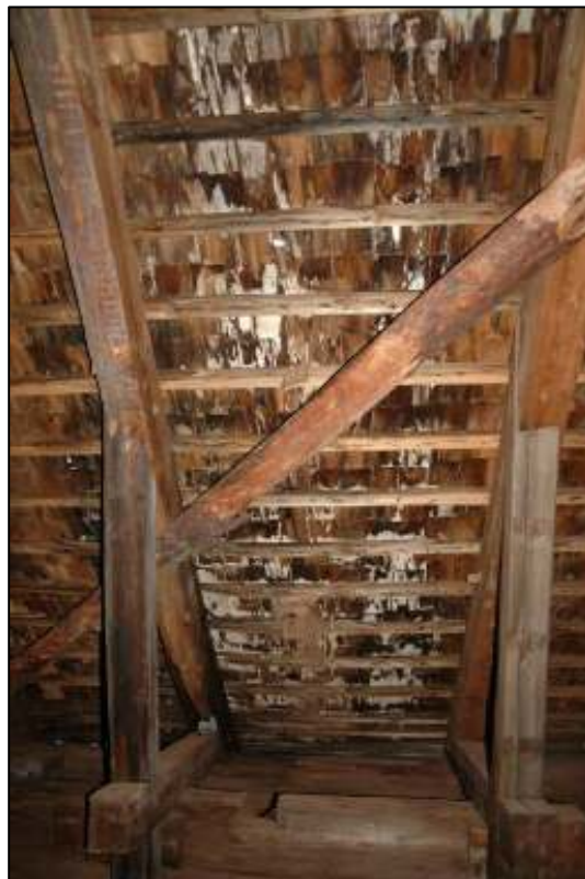
Undertakets spånor angripna av vitmögel