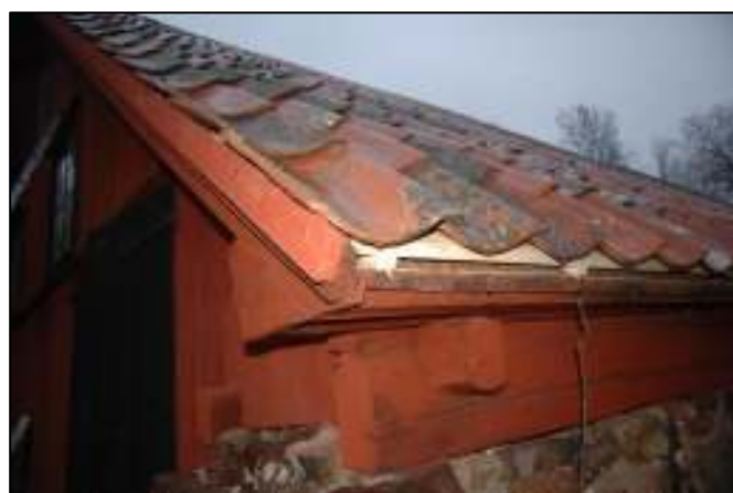
Norra gaveln – ny rödfärgad vindskiva är monterad på befintlig