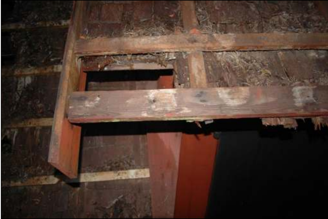
Lagning av undertak pågår