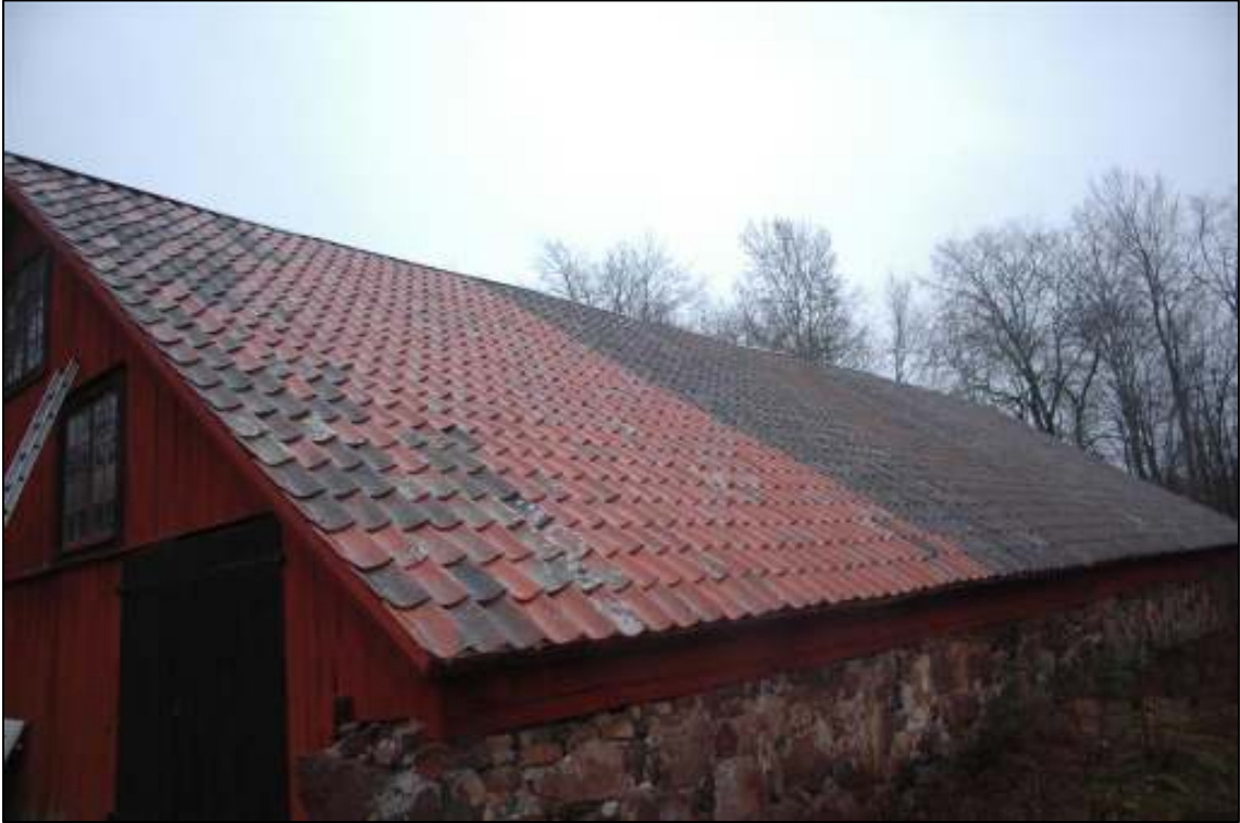
Västra takfallet omlagt med befintligt tegel och kompletteringstegel