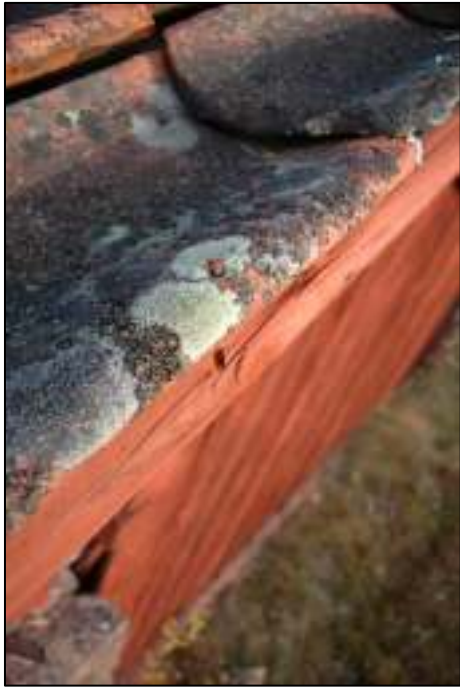
Pannorna är spikade i ytterkant