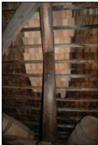
Del av undertaket lagat med laggstavar