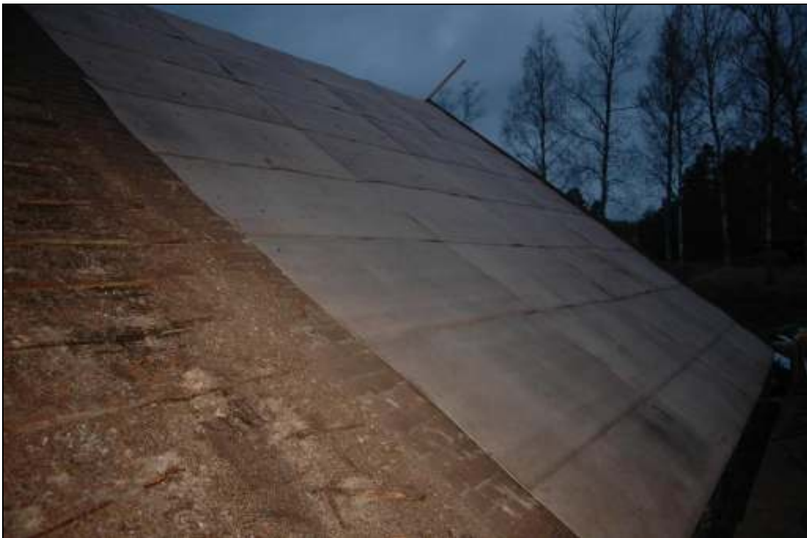
Montering av oljehärdad masoniteboard på befintligt undertak pågår