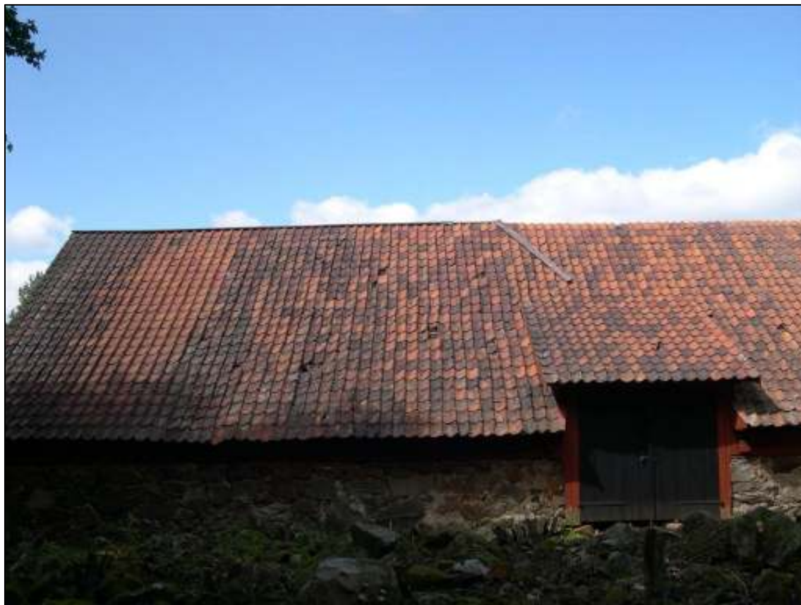
Östra takfallet före åtgärd