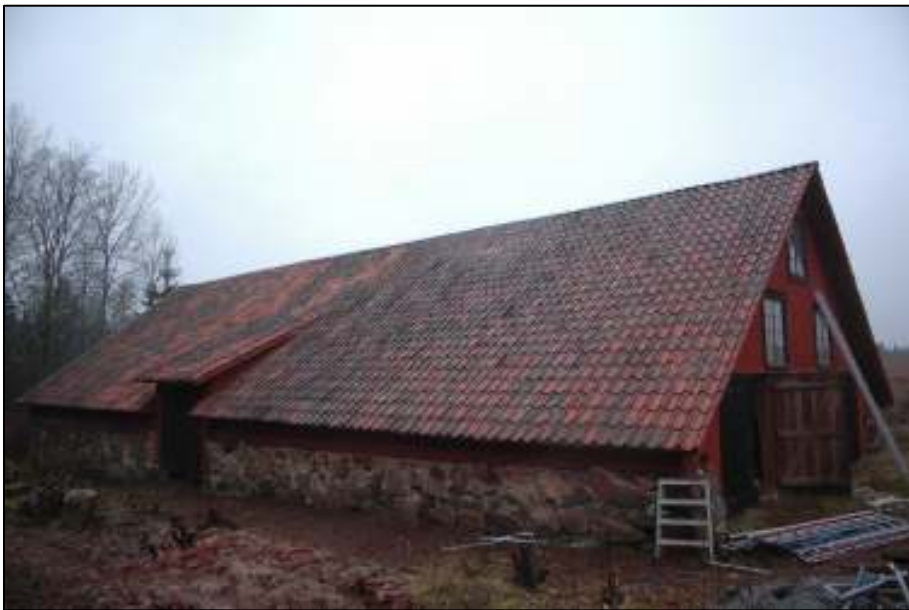
Östra takfallet omlagt med befintligt tegel och kompletteringstegel