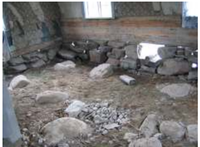
Salen innan golvbjälklaget läggs tillbaka.