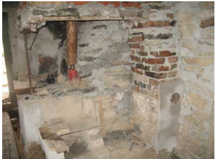
Murstocken devis murad och fogad.