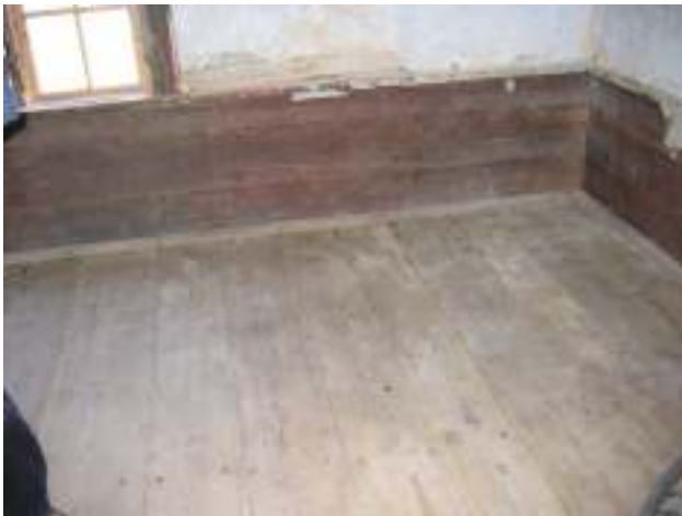
Golvbrädor och bröstpanel i kök återmonterat.