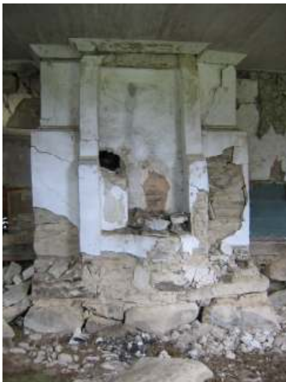
Eldstaden i salen innan åtgärd. Observera att det finns stänkmålningar i de undre ytskikten.