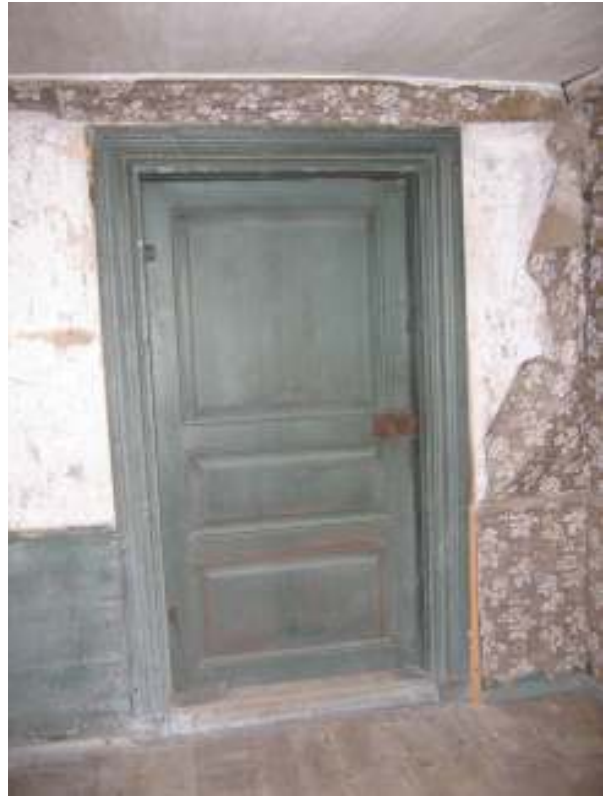
Dörrkarmen mellan hall och sal efter att den har rätats upp.