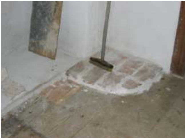
Golvet i köket kompletterat med tegel mot salen.