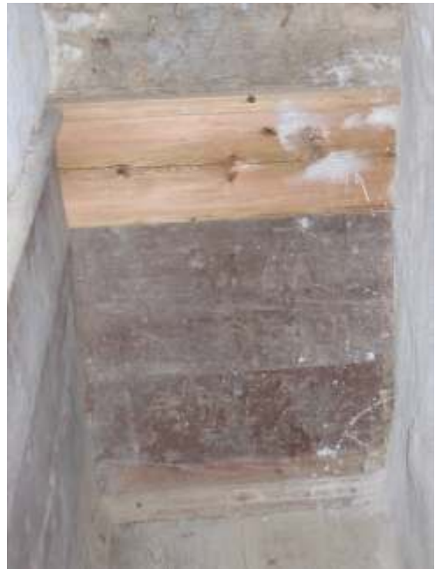
Komplettering av bröstpanelbräda i kök, nisch bakom köksspisen.