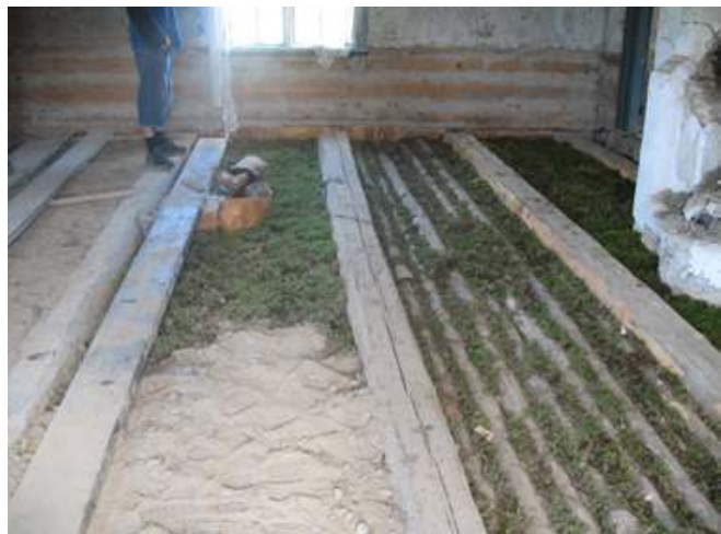
Stockbädden i salen har lagts tillbaka och tätats med ny moss, sand/jord och näver.