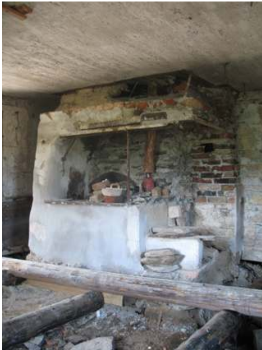
Murstocken devis murad och fogad.

Ett urval av bilder. Fler bilder finns, se fotoprotokoll.