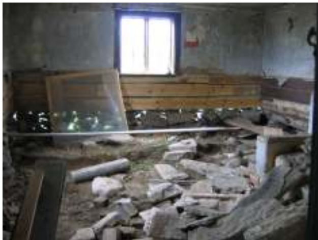
Köket innan golvbjälklaget läggs tillbaka.