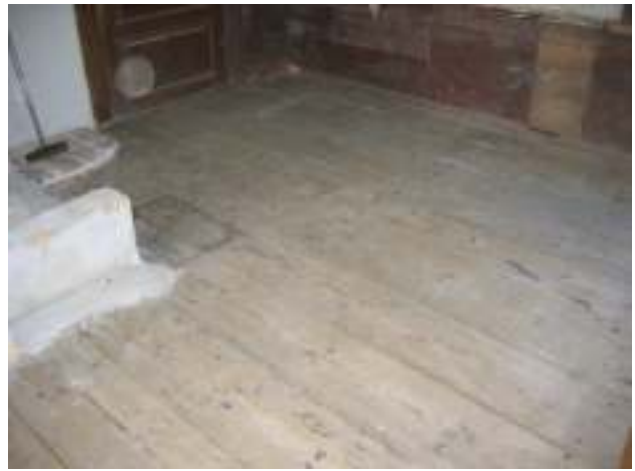
Golvbrädor och bröstpanel i kök återmonterat.