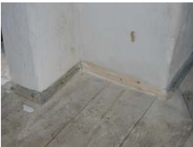
Nyillverkad golvlist vid murstock i salen, den befintliga sparad.