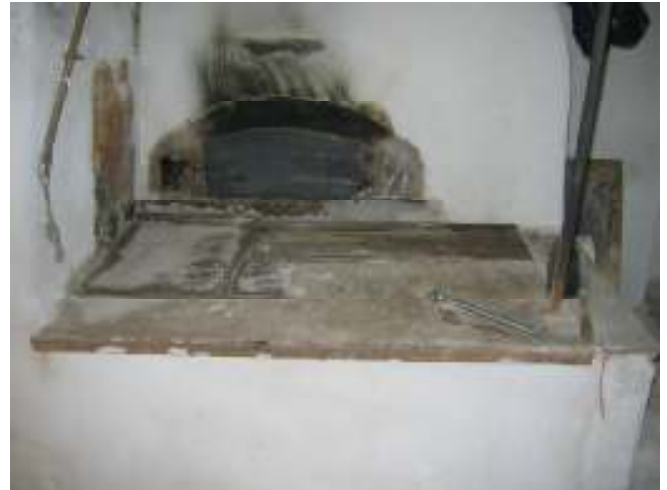
Köksspisens håll efter komplettering av järnhällar.