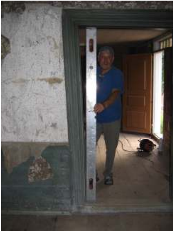
Dörröppning mellan sal och hall, innan den rätats upp.