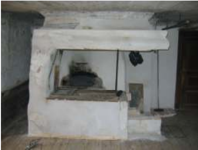
Köksspisen efter åtgärder.