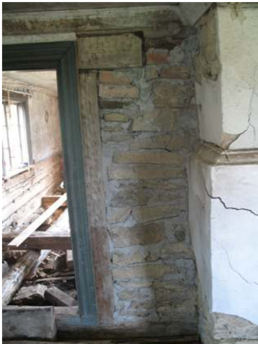
Väggen mellan salen och köket, närmast murstocken har murats upp på nytt.