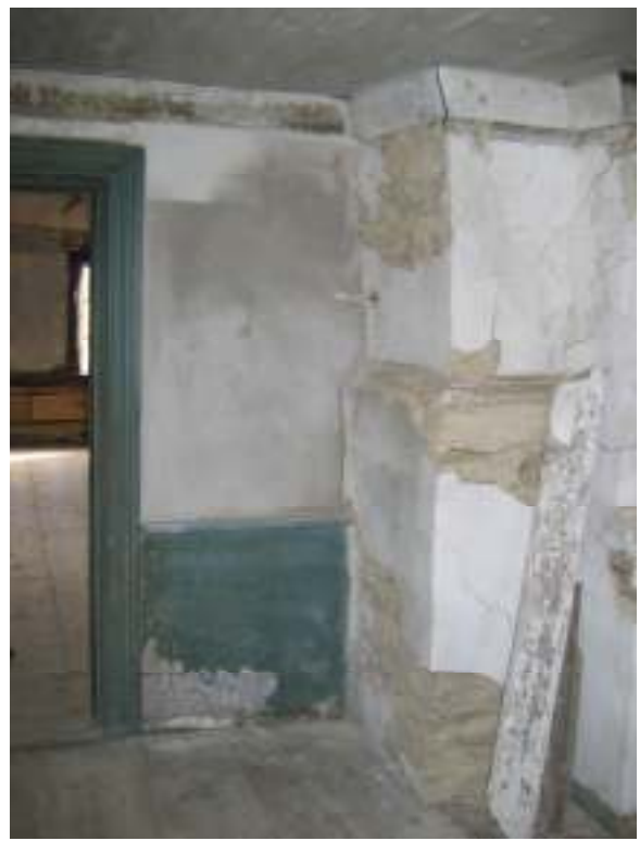
Nyuppmurad vägg mellan kök och sal, efter putsning och återmontering av bröstpanel i sal.