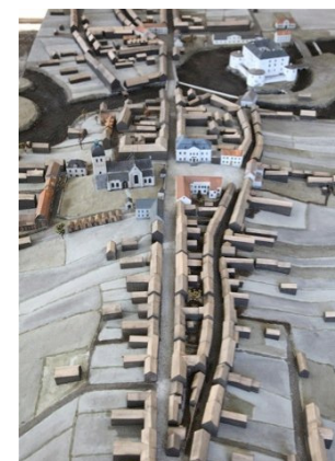
Modell över Örebro av Lars Agger.

Örebro var i början av 1800-talet en stad med drygt 3000 invånare. Det var en stad där grisar sprang fritt på de leriga gatorna och krogarna låg tätt. När riksdagen kom till Örebro behövde ytterligare ca 1000 personer någonstans att bo. En modell över staden beskriver hur de centrala kvarteren såg ut och vad som mötte de inresta riksdagsmännen och deras följe.