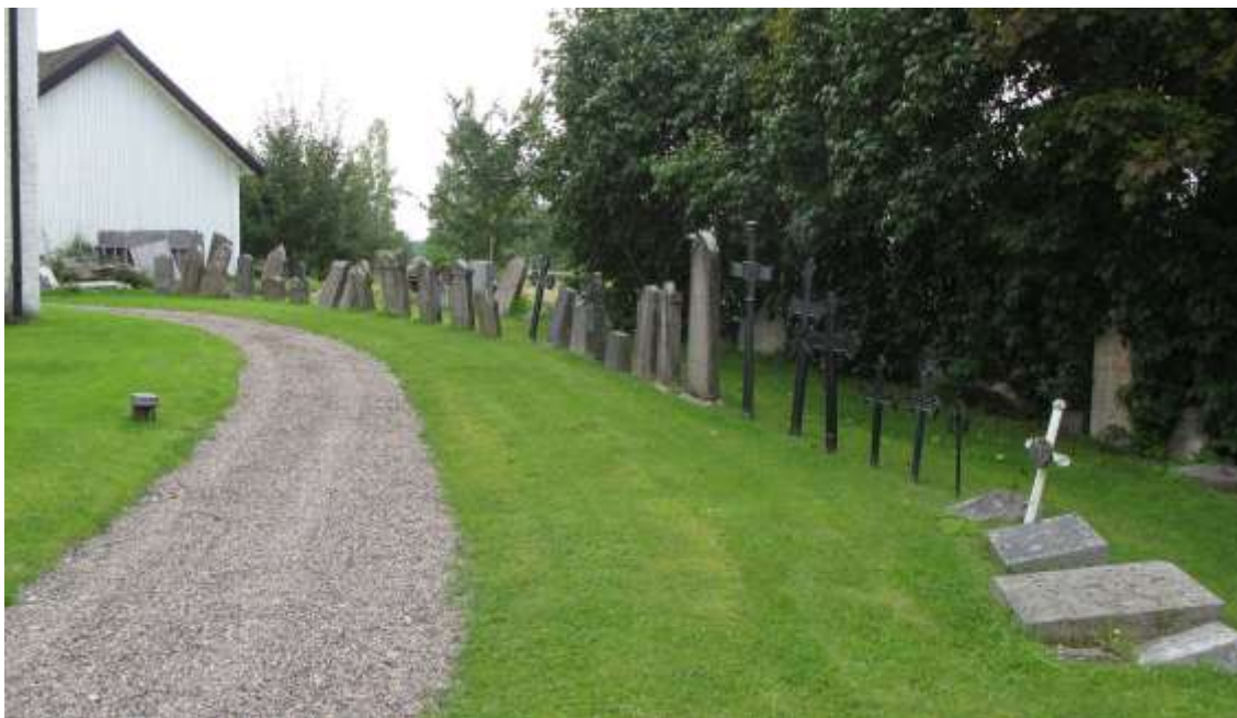
Bild av gravvårdar uppställda öster om kyrkan. Här har församlingen placerat äldre gravvårdar efter att gravrätten gått ut. Frågan är nu vad man skall göra med dem och vad värdet hos dessa vårdar är. Än så länge finns inget svar utan frågan är vid skrivande stund under utredning.