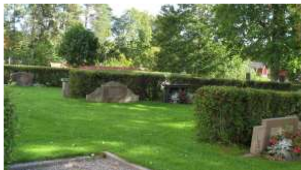
Bild till vänster: Den del av kvarteret där de äldsta gravvårdarna finns kvar. Bild till höger: Den del av kvarter A som ligger direkt söder om kyrkan. Här är de flesta stenar breda och låga.