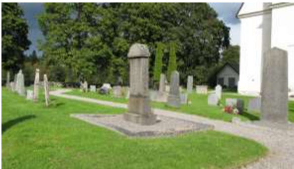
Bild till vänster. Närmst i bild kvarter E, bortom det kvarter D.

Kvarterets yttre kant i väster är gränsen för kyrkogårdens äldre del innan utvidgningen 1907-1908.