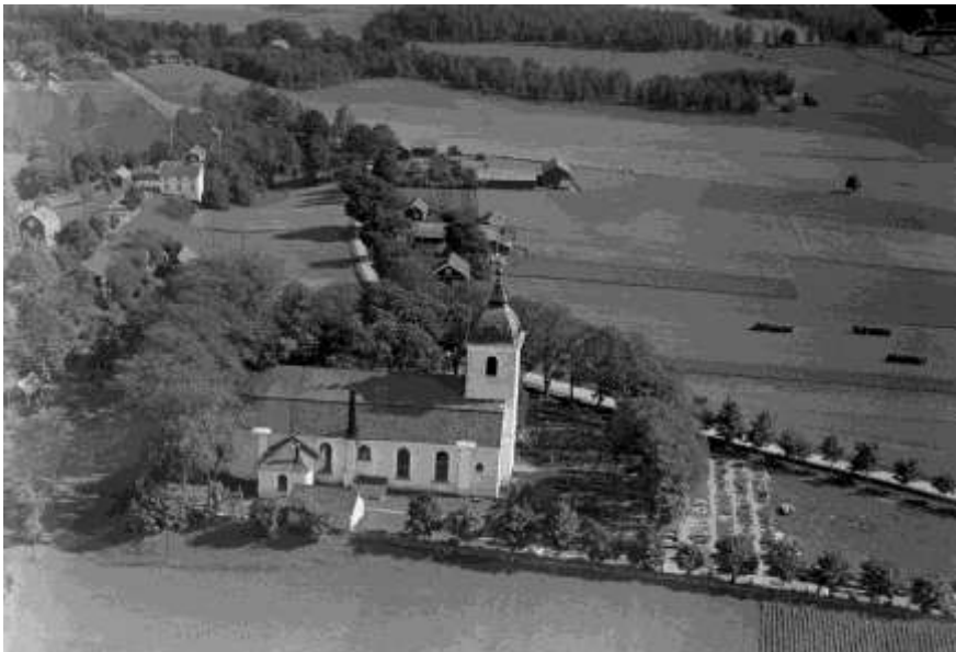
Äldre flygfoto över kyrkogården. Bilden tagen från norr.

Kyrkogården utvidgas 1907 -08. Denna utvidgning sker västerut och benämns idag kvarter E. Ingång sker genom två järngrindar i söder, den östra har putsade grindstolpar och den västra har grindstolpar av granit. En nivåskillnad i marken är tydlig mellan utvidgningen och den äldre delen av kyrkogården. Vid mittgången från kyrkans västra entré är en trappa placerad vid nivåskillnaden.