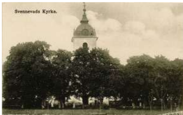
Svennevads kyrka och kyrkogård sett ifrån väst alldeles efter utvidgningen.

Norr om kyrkan finns en förrådsbyggnad i trä med delvis putsade fasader. I anslutning till parkeringen utanför kyrkogården i söder finns församlingshemmet.