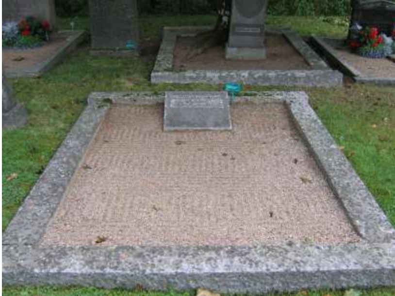
En kulturhistoriskt värdefull gravvård med sand och stenram som går att återanvända, kvarter 4 på Ramsbergs gamla kyrkogård.

I dag är tankar om hushållning och återanvändning av naturens resurser högaktuella. Centrala gravvårdskommittén tog 1998 fram en skrift, ”Gravvårdar - allmänna råd för bevarande och återanvändning”, som belyser möjligheterna till detta, råd för att värna, bevara och återanvända gravvårdarna på kyrkogårdarna. Återanvändning av gravanordningar och gravstenar uppfattas av många som en svår fråga. Det förekommer i Sverige och är på vissa håll en sed men på andra håll en helt främmande företeelse.