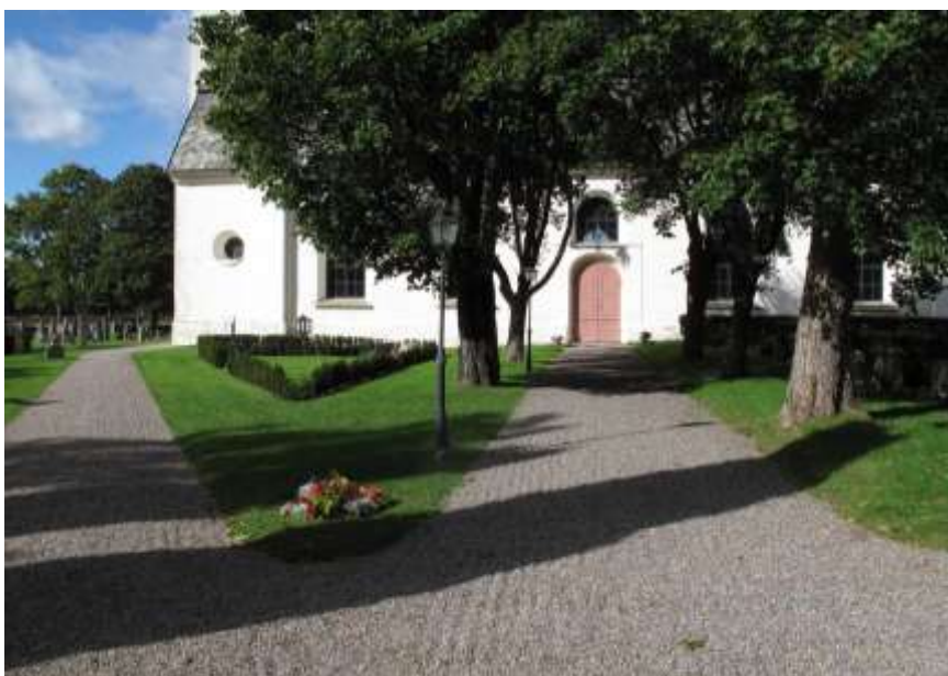
Bild till vänster. Minneslunden som är placerad söder om långhuset mellan torndelen och ingången.