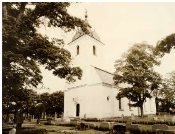
Den äldre delen av den nuvarande kyrkogården. Bilden tagen från syd-väst.