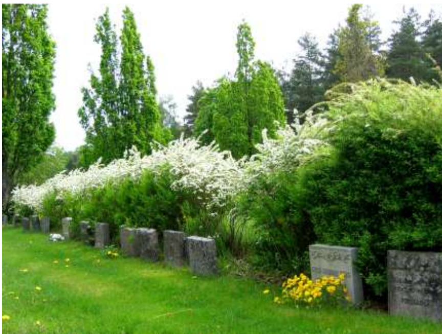
En välbevarad rad med allmänna linjegravar i kvarter 5 på Södra kyrkogården, Lindesberg.

Under 1800-talets senare del blev det allt vanligare för samhällets arbetare och medelklass att skaffa sig egen gravplats och påkostade gravvårdar. Samtidigt blev de förmögnas gravvårdar allt mer exklusiva. Parallellt med den strikt anlagda kyrkogården började man mot slutet av 1800-talet anlägga kyrkogårdar med en mindre stram utformning, inspirationen hämtades från den engelska parkens friare former och landskap.