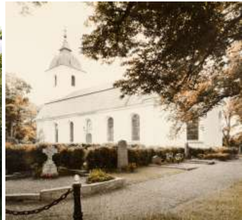
Bild till vänster. Del av kvarter med grusgång som leder in öster om kyrkan. Bild till höger: Odaterad bild ur Örebro läns museums arkiv. Grusgraven till vänster i bilden finns kvar än i dag.