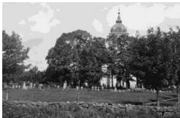
Svennevads kyrka och kyrkogård sett ifrån väst efter utvidgningen. Observera vårdarna med träkors.