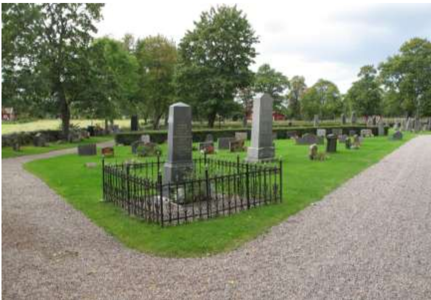
Kvarter C bilden är tagen från söder.

Kvarter C: Kvarterets placering är mellan den huvudsakliga ingången med järngrindar i syd och sträcker sig fram till den västra delen av kyrkan vid tornet. I kvarterets ytterkant längs med muren är gravvårdarna placerade med ryggen mot muren. Kvarteret har i huvudsak gräsytor med en oregelbunden form och kantas av grusgångar. I den västra delen är gravvårdarna placerade med ryggen mot lågt klippta häckar. Monumentala gravar med höga gravvårdar och smidesstaket finns i början av kvarteret och längs med grusgångarna i syd-nordlig riktning. De äldsta gravarna är placerade alldeles framför tornet i kvarterets västra del.