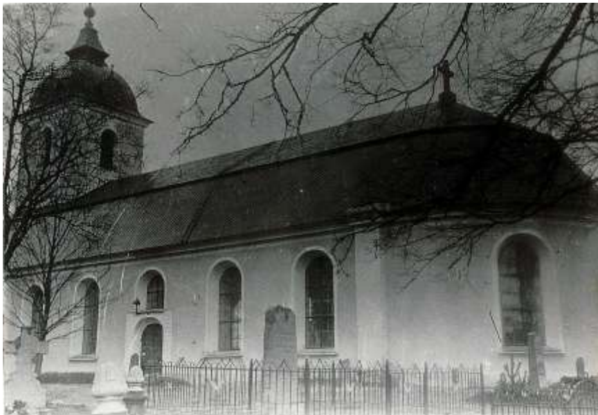
Bild till vänster, kvarter A: Odaterad bild ur Örebro läns museums arkiv. Bild tagen från hörnet i sydöst. Man kan ana de gjutna stolparna på grav nr. 173-178 i bildens nedre vänstra hörn.