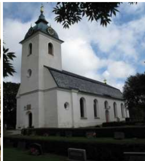
Kvarter C. Nytagen bild från samma vinkel.