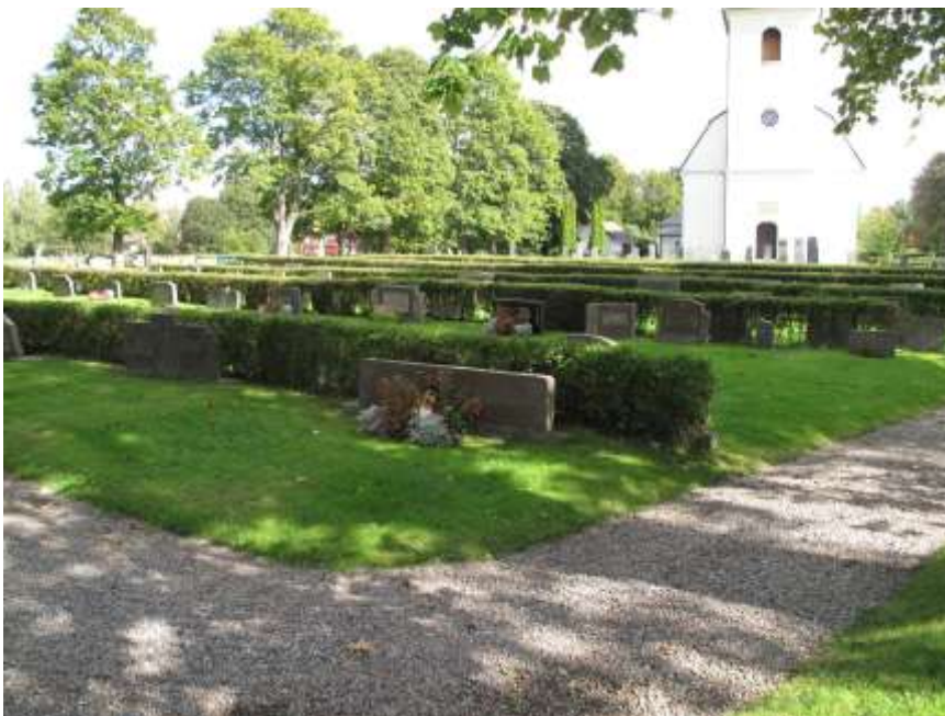
Kvarter E bilden tagen från väst. Gravvårdarna ligger med ryggar mot häckar i nord-sydlig riktning.

Gravarna är placerade mot lågt klippta häckar i rader från syd till norr. Kvarteret avgränsas med stenvuren på tre sidor där de äldsta gravarna är placerade i norr med ryggen mot stenvuren. I den del av kvarteret som är närmast kyrkan finns det en del linjegravar kvar. Gravvårdarna är i huvudsak låga och breda. Gravsättningarna har skett kontinuerligt från 1950-talet i den västra delen och sedermera har man fyllt på efterhand och då har de senaste gravvårdarna i modern tid placerats i öster närmast kyrkan.