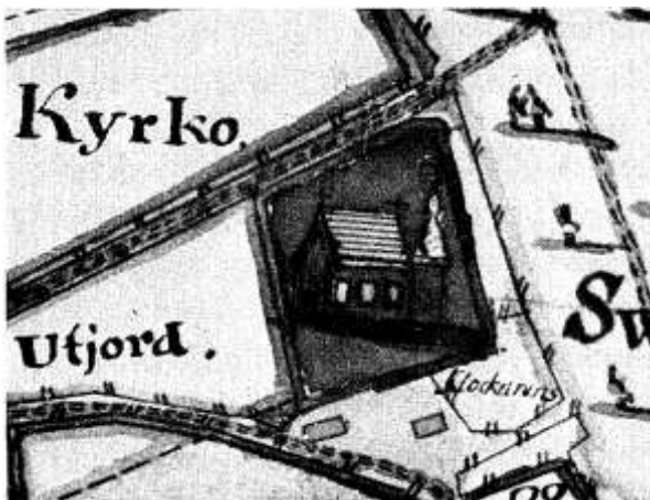
Äldre odaterad bild över Svennevads kyrka.

Invändigt sätter den speciella inredningen i svart och guld sin särskilda prägel. När kyrkan byggdes bestämde Wennerstedt nämligen att koret skulle fungera både som gravkor och kyrkokor. Under det förhöjda korgolvet finns gravvalv för bruksägarfamiljerna Wennerstedt på Skogaholm och Wester på Haddebo. I kyrkan finns också en rik uppsättning av begravningsvapen främst från 1600- och 1700-talen. Detta ger kyrkan en karaktär av att, utöver sockenkyrka, också vara en begravningskyrka eller minnesplats till bruksägarfamiljerna. Kyrkan räknas som en av de mest homogena och ståtliga gustavianska kyrkorna i Sverige där också färgsättningen i svart och guld är ytterst ovanlig.